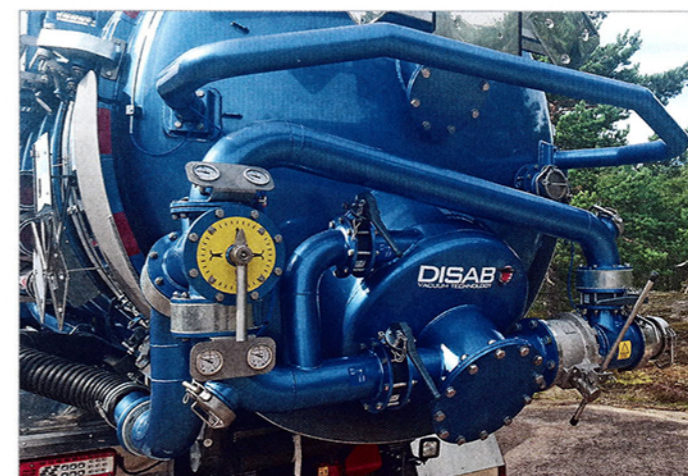
Kaikki sulkuventtiilit ovat säiliön ohella valmistettu haponkestävästä AISI 316 -teräksestä. Letkut ja putket liitetään toisiinsa Disabin itse kehittämällä Disaflow-liittimillä. Ne ovat kestäviä ja tiiviitä.