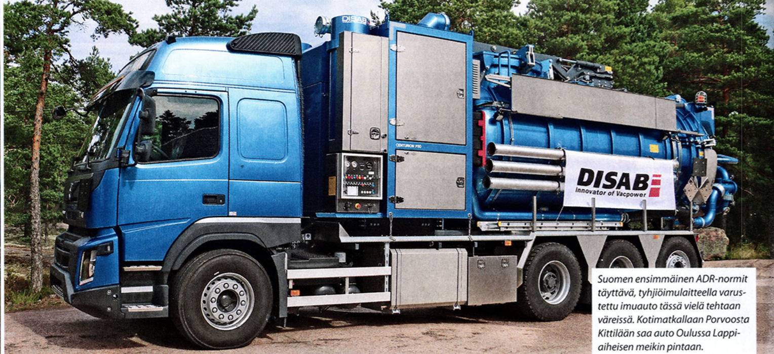
Suomen ensimmäinen ADR-normit täyttävä, tyhjiöimulaitteella varustettu imuauto tässä vielä tehtaassa väreissä. Kotimatkallaan Porvoosta Kittilään saa auto Oulussa Lappi-aiheisen meikin pintaan.