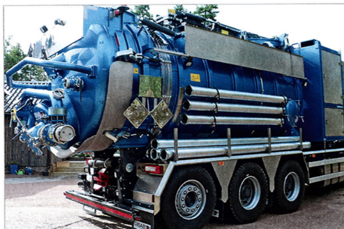
Pitkät ruostumattomasta materiaalista olevat lokasuojat toimivat hyvänä laskutasona sekä kuljetusalustana varusteille. Letkuilla ja alumiiniputkilla on kaikilla omat paikkansa säiliön sivulla.

Porvoossa toimiva MAP Oy on toimitannut ADR-vaatimukset täyttävän tyhjiöimulaitteen asiakkaalleen. Normit täyttävä Disab Centurion P30 ARD -imulaite on asennettuna Volvo FMX 540:n päälle ja kokoonpano tulee Hettula Oy:n käyttöön Kittilään. Syysskuun alussa asiakkaalle Porvoossa luovutettu laite matkasi Kittilään Oulussa toimivan maalarin kautta. Siellä ajoneuvon kylkeen taotaan Hettula Oy:n autoille tyypillinen Lapin ilme.