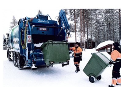
▲ Hettula kerää Kittilän seudulla yritysten ja elinkeinoelämän talousjätteitä.