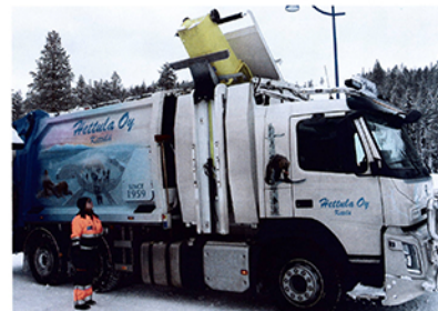
▲ Ohjaamon ja pakkarin välissä sijaitsevan välisäiliön voidaan kerätä esimerkiksi lasia, metallia, kartonkia tai muovia.