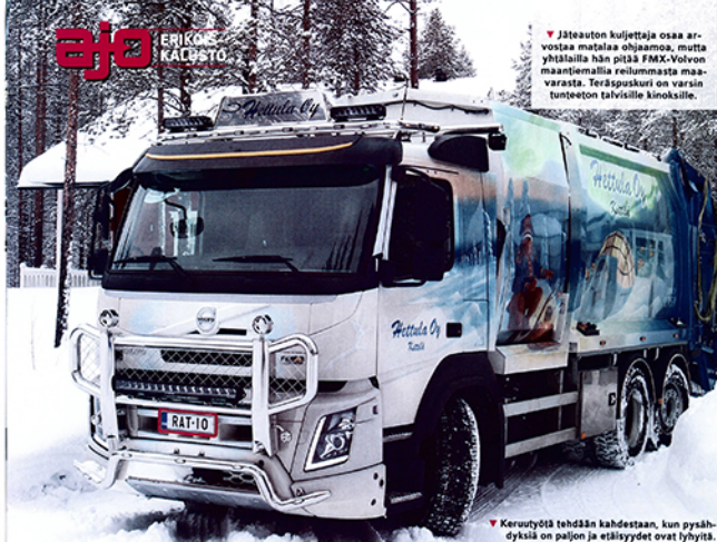
▼ Jäteautojen kuljettajia osaa arvostaa matala ohjaamo, mutta yhtiöillä hän pitää FMX-Volvon maantiemällä reilumasta maavarausta. Törsäpuuhari on varsin tunteeton tavallisille kinkkoille.