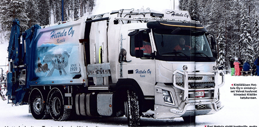
▲ Kittiläläinen Hettula Oyn sinisävyiset Volvo-t kuolvat kiinteästi Kittilän katukuvaa.